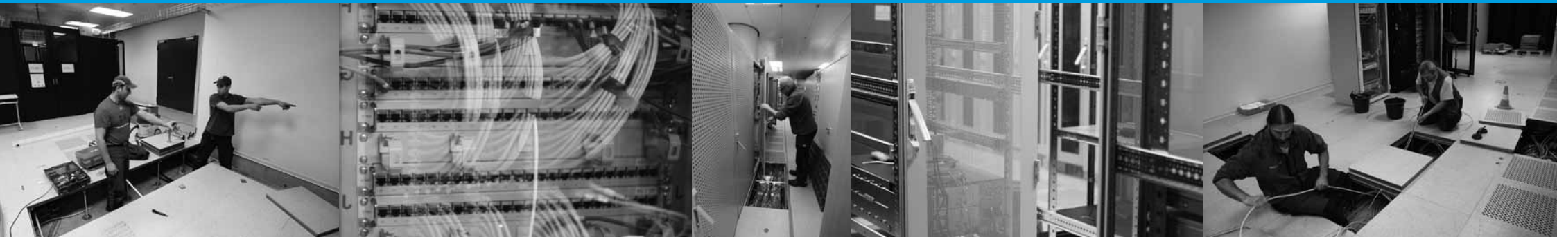
Umbauarbeiten im Rechenzentrum